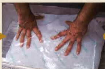
水中に投入後、全体を軽く揉む