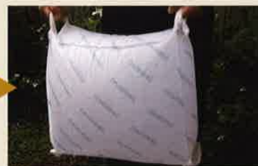
約2分後に約20kgの土嚢が完成