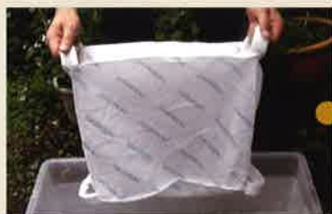
吸水前は約 0.27kg の不織布袋